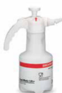
Food-Matic 1.25 P mit Regulierdüse Art.Nr. 11990801

Geeignet für den Kontakt mit Lebensmitteln